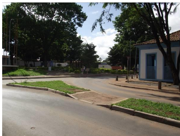
Fig. 2 Museu Histórico e Artístico de Planaltina – Fachada Leste (2010). Fig. 3 Museu Histórico e Artístico – Trecho da Fachada Norte (dir.) e Av. Goiás (2010).

Em 2006, Medeiros e Ferreira (2006) anotaram várias intervenções pontuais no edifício do museu, com a inserção de materiais contemporâneos, facilmente percebidas como a introdução de alvenaria de tijolos maciços cozidos no lugar do adobe e a substituição do revestimento em argamassa de barro e cal, por argamassa de cimento e areia. As patologias mais comuns identificadas naquele momento foram a presença de insetos xilófagos, trincas de revestimento e manchas de umidade. Um ano antes, o museu fora atingido em sua fachada principal por um veículo desgovernado que, além de destruir um trecho da parede, afetou parte do telhado da sala, que ruiu. Após o acidente, reflexo de problema de mobilidade, o museu ficou fechado até ser restaurado em 2007. Nessa intervenção o local foi parcialmente adaptado para atender aos requisitos da norma de acessibilidade NBR-9050 e uma nova escada e rampa de acesso executadas em concreto e aço foram instaladas na fachada posterior. Em 2012, em razão de processos de degradação a edificação passou por nova intervenção. A adaptação para acessibilidade, realizada em 2007, que impactava fortemente na edificação preexistente, especialmente pelo uso do vidro e aço inoxidável, foi removida, apoiada no princípio da reversibilidade, sem causar danos ao patrimônio.